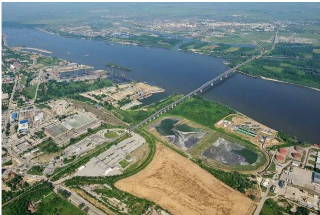
Podul prieteniei dintre ora ul Ruse i Giurgiu