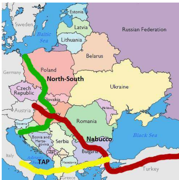
Fig. 2. Dependența "efectivă" de Rusia (BERD), mai mică decât cea fizică în funcție de inter-conectări și diversificare. Conducele-fantomă către Est vs. proiectul european fezabil Nord-Sud

va vinde unei țări A cu 500 și altelea vecine B cu 100, fără clauze de destinație, iar între A și B există interconectori, B poate vinde lui A cu mult sub 500 și astfel piața se lichidizează și se echilibrează singură, fără intervenții politice care cer timp și efort. Chiar dacă azi gazul lichefiat e mult mai scump decât gazul rusesc și merge spre Asia, lucrurile se pot schimba în timp.