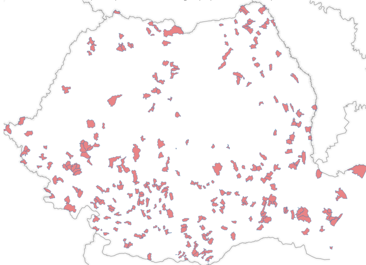
Localități unde primarul a migrat spre PSD