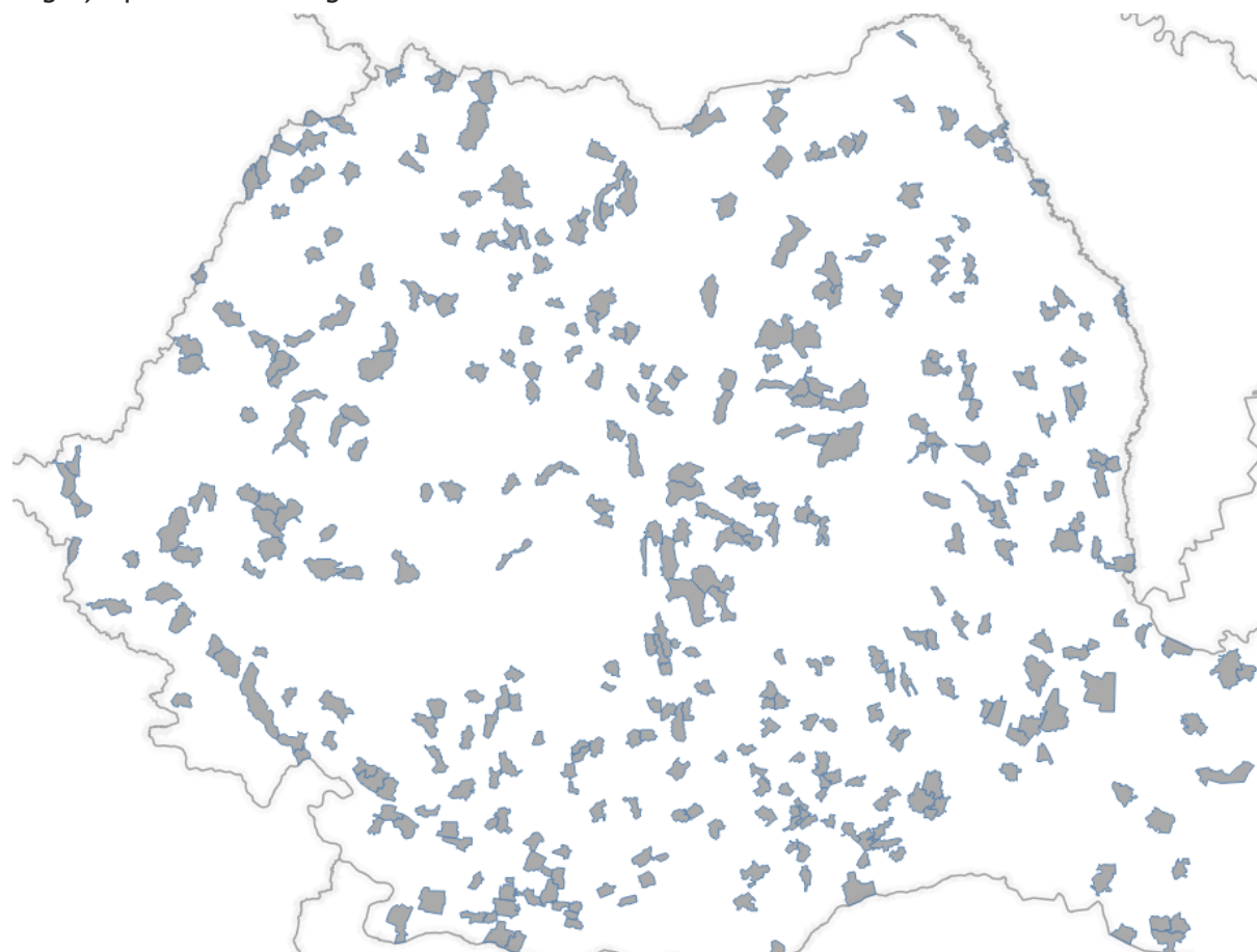
Localități unde primarul nu se mai regăsește pe lista de candidați din 2024